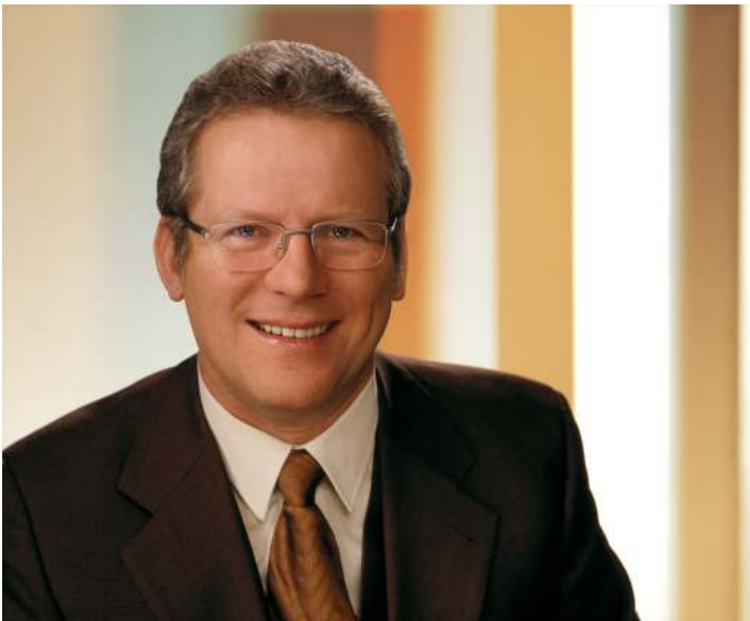
Dr. Alfred Finz (Staatssekretär im Bundesministerium für Finanzen)